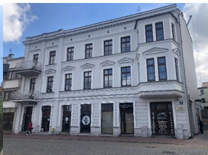
Kamienica po pracach konserwatorskich