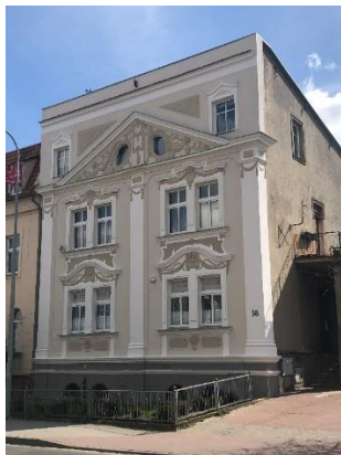
Kamienica po pracach konserwatorskich