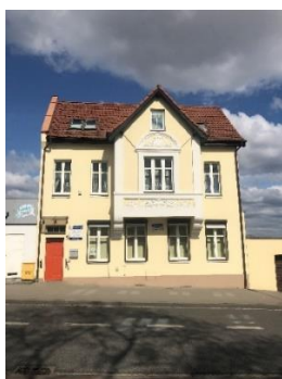
Kamienica po pracach konserwatorskich