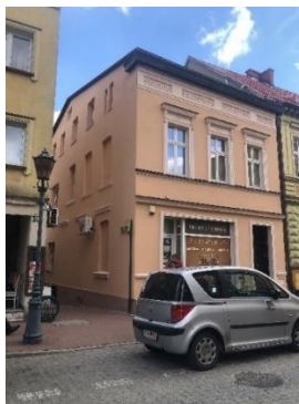
Kamienica po pracach konserwatorskich