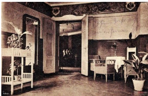
Lata 1918-1920 , Wnętrze Hotelu "Reichshof", pas odnalezionych polichromii ściennych